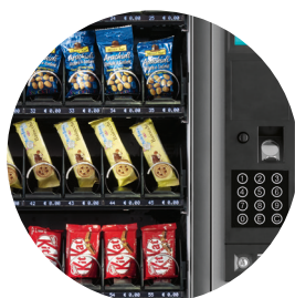
Un design elegante e raffinato