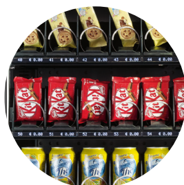
Vetrina ad alta visibilità